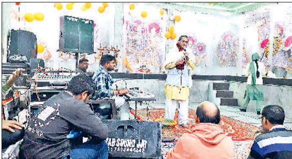
झज्जर। श्रीराम मंदिर में भजनों की प्रस्तुति देते हुए गायक कलाकार।