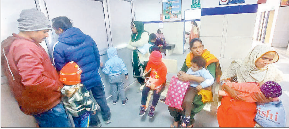
झज्जर। बाल रोग ओपीडी के बाहर अपने बच्चों के साथ उपस्थित अभिभावक।

खासकर नवजात शिशु से लेकर पांच वर्ष तक के बच्चे सर्दी का शिकार