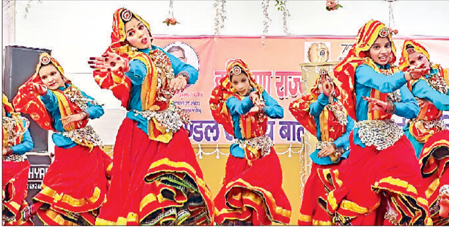
झज्जर। समूह नृत्य की प्रस्तुति देते हुए छात्र।