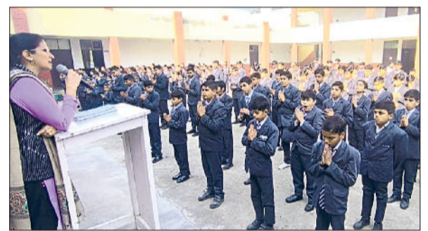
बहादुरगढ़। बच्चों को जागरूक करती शिक्षिका।