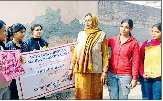
बहादुरगढ़। बामडोलली में जागरूकता मुहिम चलाती छात्राएं।