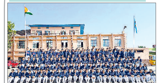
झज्जर। वीवीएम स्टेट कैंप में चयनित विद्यार्थी।