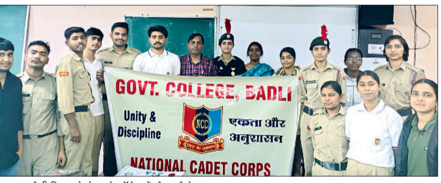
बहादुरगढ़। रैली निकालने से पहले कॉलेज में मौजूद केडेट्स।

राजकीय महाविद्यालय बादली की एनसीसी इकाई ने राष्ट्रीय साइबर सुरक्षा दिवस व राष्ट्रीय प्रदूषण नियंत्रण दिवस पर जागरूकता कार्यक्रमों का आयोजन किया। इन गतिविधियों का उद्देश्य विद्यार्थियों और स्थानीय समुदाय में डिजिटल सुरक्षा तथा पर्यावरण संरक्षण के प्रति समझ बढ़ाना था। कार्यक्रम की शुरुआत साइबर सुरक्षा जागरूकता सत्र से हुई, जिसमें केडेट्स ने पोस्टरों के माध्यम से ऑनलाइन धोखाधड़ी, सॉफ्टवेयर लिंक, पासवर्ड सुरक्षा, साइबर बुलिंग और सुरक्षित इंटरनेट उपयोग जैसे महत्वपूर्ण विषयों पर जानकारी दी। सतर्क रहें-सुरक्षित रहें थीम पर आधारित प्रदर्शनी को