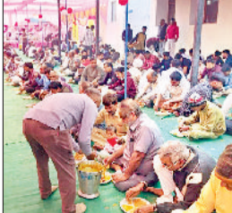
झज्जर। बिजली निगम कार्यालय परिसर में आयोजित भंडारे में प्रसाद ग्रहण करते हुए श्रद्धालु।

धार्मिक महत्व है। एकादशी भक्ति, कर्म व ज्ञान का संदेश देती है।