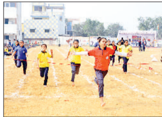
झज्जर। दौड़ प्रतियोगिता में अपनी जीत दर्ज करते हुए प्रतिभागी खिलाड़ी।