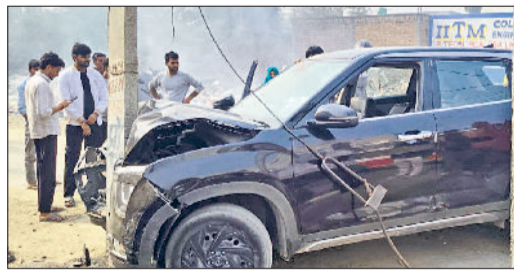
बहादुरगढ़। पोल से टकराई कार।