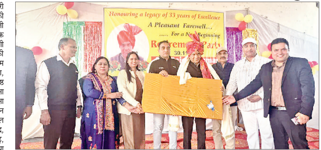
झज्जर। कार्यक्रम के दौरान स्मृति चिन्ह भेंट करते हुए प्राचार्य एवं शिक्षक।