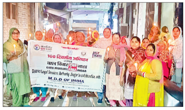
झज्जर। बेरी में कैडल मार्च निकालते हुए आंगनवाड़ी कार्यकर्ता एवं महिलाएं।